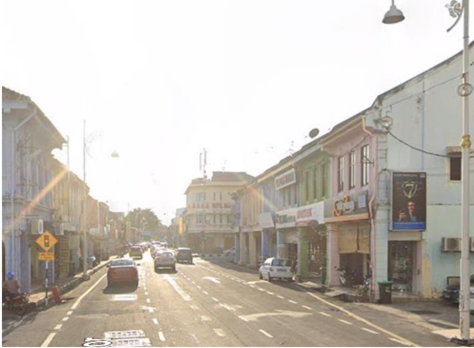
GAMBAR LOKASI (Jalan Jubli Perak)