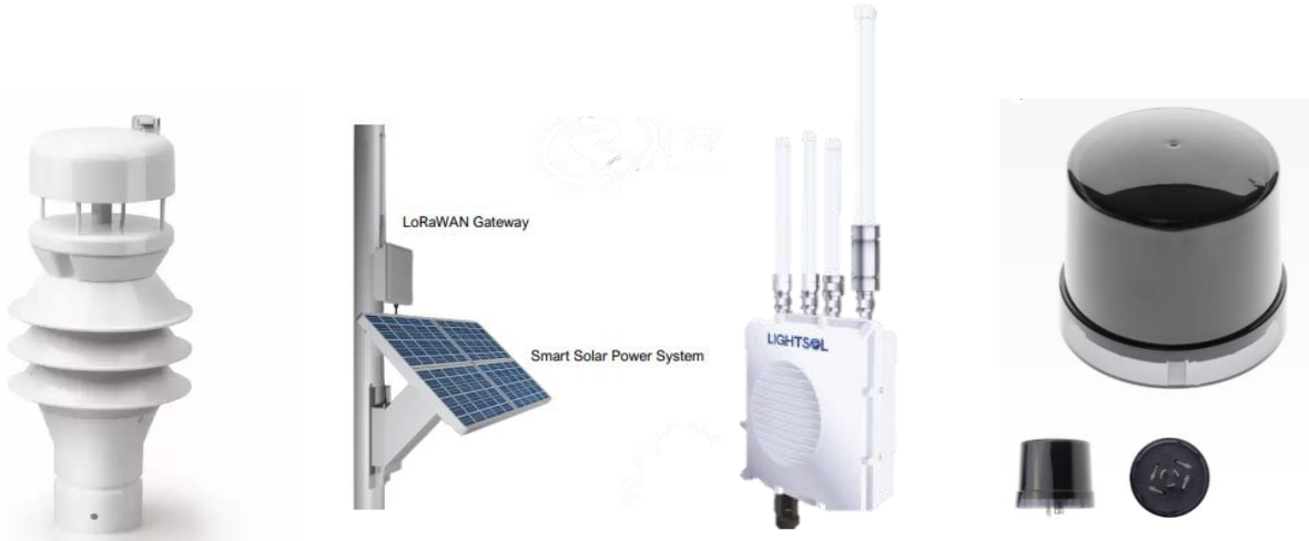
Mini WEATHER STATION